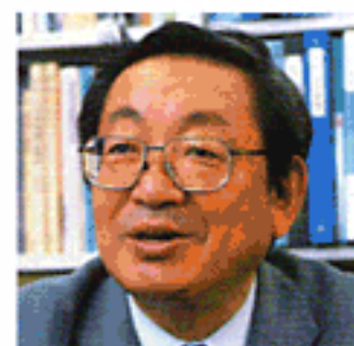
原田信男(はらだ・のぶお)

国士舘大学21世紀アジア学部教授。専門は日本生活文化史・日本文化論。著書に『歴史の中の米と肉』(平凡社ライブラリー)、『中世村落の景観と生活—関東平野東部を中心として』(思文閣史学叢書)、『江戸の食生活』(岩波書店)など。