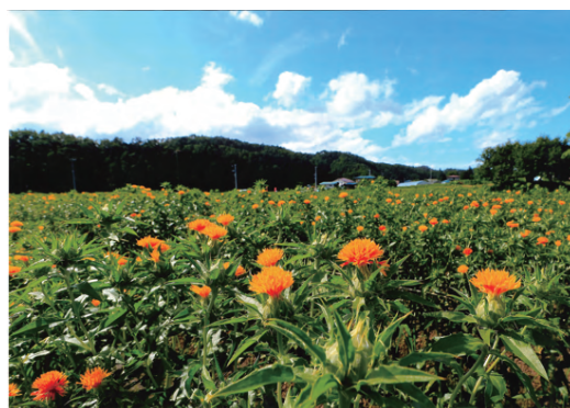
令和元年 入選作品「紅花の咲く町」