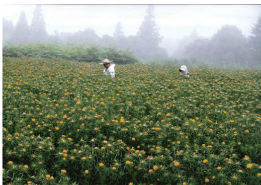
令和元年 特選作品「中山の朝」