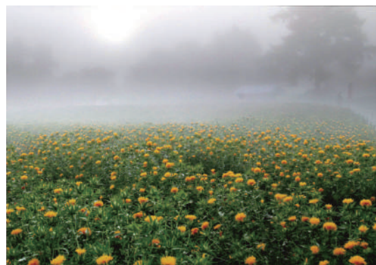
第26回 グランプリ作品「霧包む」