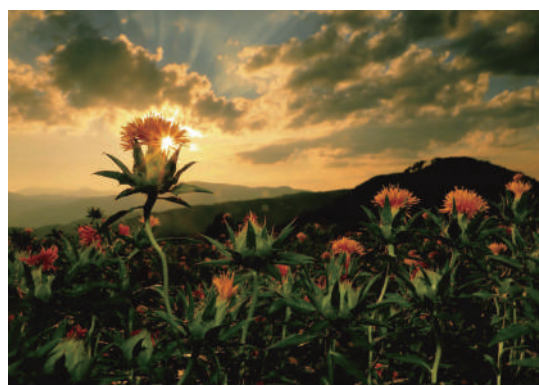
第26回 特選作品「夕日に染る」