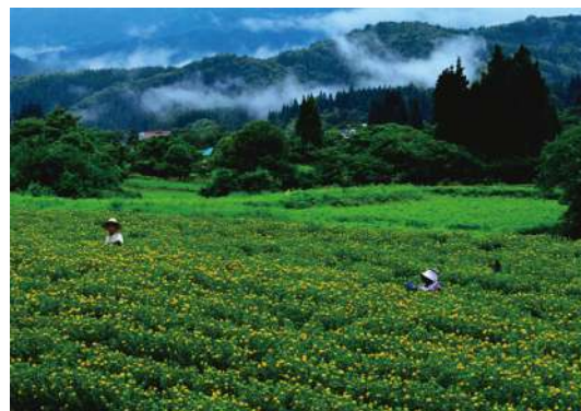
第27回 特選作品「高原の摘み取り」