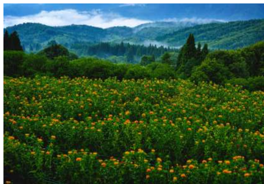
第27回 グランプリ作品「紅花の山里」