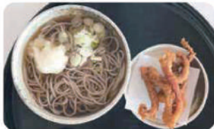
げそ天かけそば 冷温 ¥850