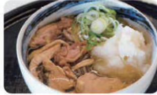
おろし肉そば 冷温 ¥900