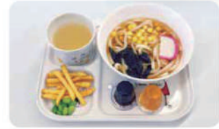
お子様 うどんセット ¥550