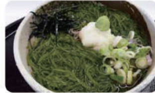
めかぶそば 冷温 ¥800