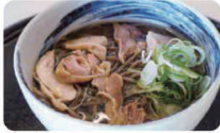
肉そば 冷温 ¥800

※全て税込表示です ※写真は普通盛りです ※種の量…普通盛→200g / 大盛→250g / 特盛→350g