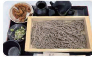
げそ天小板そば 冷 ¥850