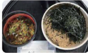
ピリ辛つけそば 温 ¥900