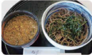
つけそば 冷 ¥800