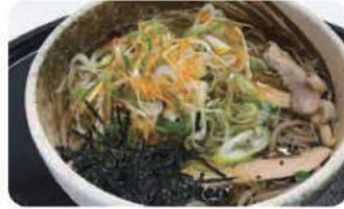
ピリ辛ネギそば 温 ¥900