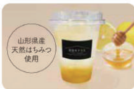
ハニーレモン スカッシュ ¥400