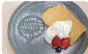
シフォンケーキプレート ¥680