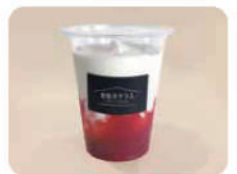
雪どけいちご ミルク ¥450