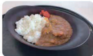
そば屋の カレーライス ¥750