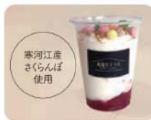
飲むチーズケーキ (さくらんぼ) ¥500