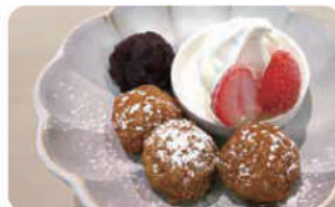
そばがき甘味プレート ¥650