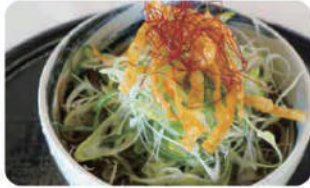
ネギそば 冷温 ¥800