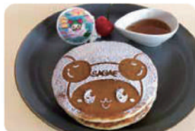
チェリンパンケーキ ¥500