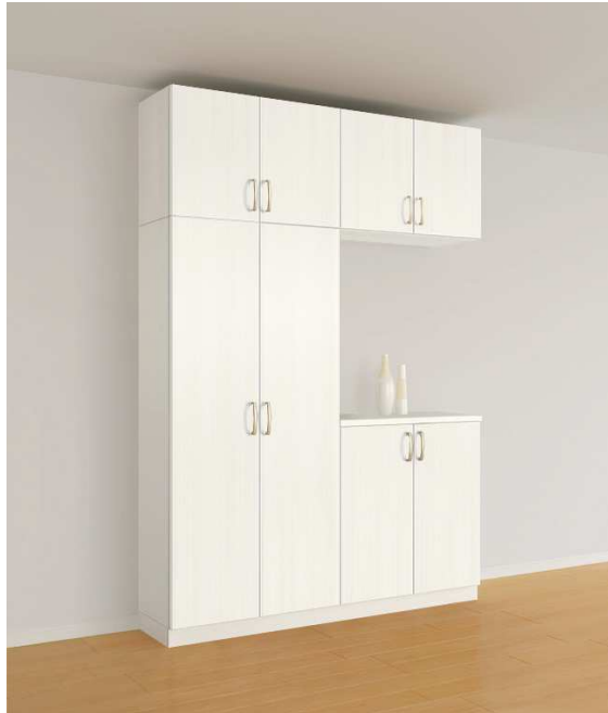
【標準】コの字型 大容量の収納を確保。