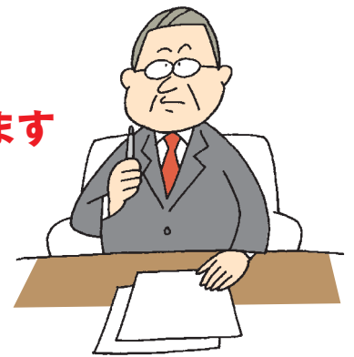
株式会社オールアバウト社の知的資産経営報告書(2005)