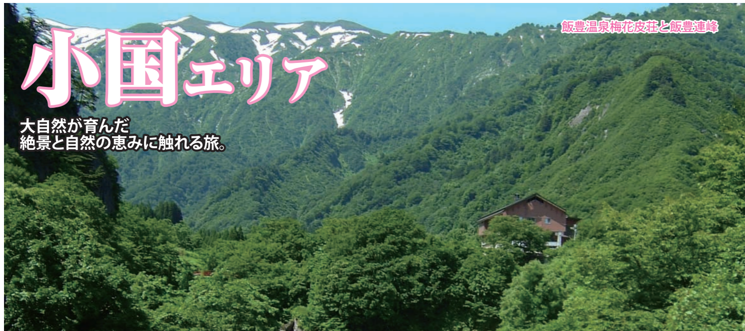
飯豊温泉梅花皮荘と飯豊連峰