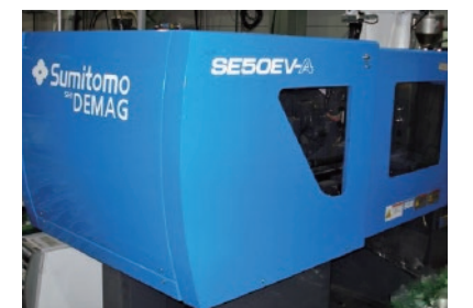
高圧仕様射出成形機