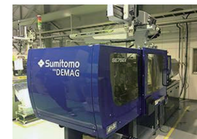
高温仕様射出成形機