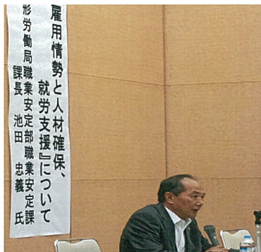
<池田山形労働局職業安定部職業安定課長>

また、広報誌とともに、12自治体ではホームページで常時閲覧できるようにご対応いただいております。協会ホームページへのアクセス仕様のバージョンアップをお願いしました。