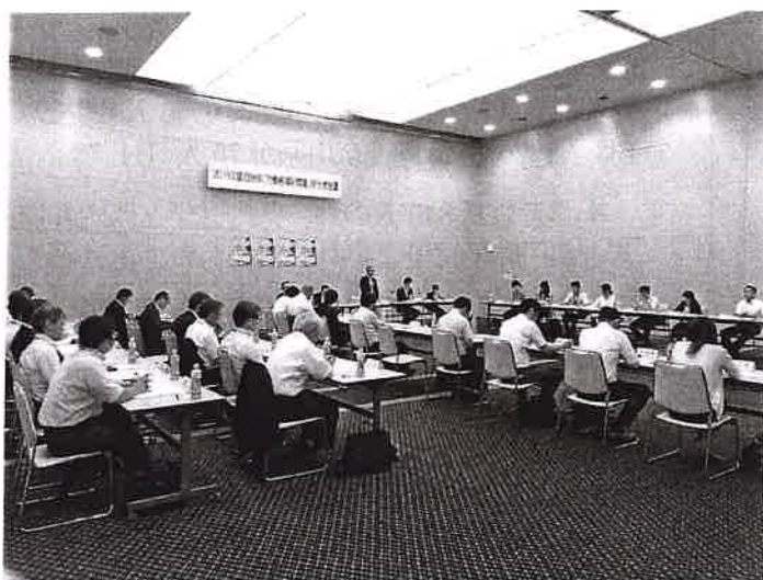
< 会議風景 >